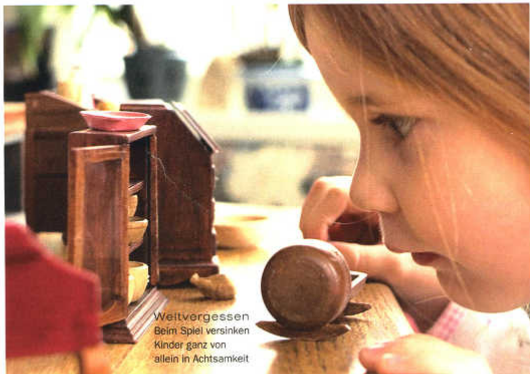
Weitvergessen Beim Spiel versinken Kinder ganz von allein in Achtsamkeit

Ein MBSR-Trainer ersetzt weder Arzt noch Psychotherapeut . Kombi-Behandlungen im Knappschafts-Krankenhaus: www.kliniken-essen-mitte.de